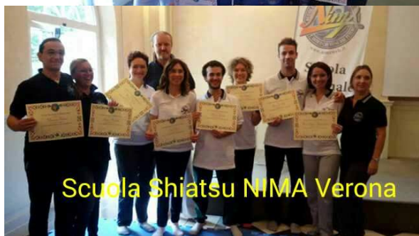
Scuola Shiatsu NIMA Verona